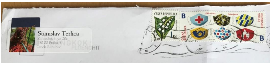
Afbeelding 6 Brief uit Tsjechië met mondkapjes postzegel

Uit Tsjechie kwam een leuke brief met postzegels met mondkapjes erop, en in de envelop zat een leuke ansichtkaart ook met het thema Corona. (Betreffende kaart werd op de Hoornblazer van oktober 2020 afgebeeld, aanvankelijk zou dit artikel daarin geplaatst worden maar ik moest het op het laatste moment wijzigen en vergat een andere afbeelding op de voorkant te plaatsen. red. )