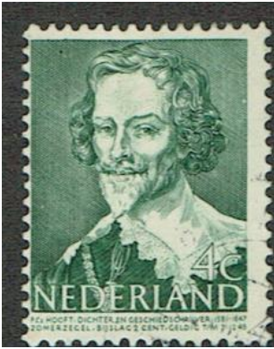
Figuur 5 P.C. Hooft NVPH 491 Groot dichter en vriend van Maria Tesselschade

Maria Tesselschade Roemer Visschersdochter (Amsterdam, 25 maart 1594 – Amsterdam, 20 juni 1649) zat helemaal niet op veel aandacht te wachten. Ze liet nooit een portret van zichzelf maken en liet haar gedichten nooit in drukvorm uitbrengen. Er zijn slechts 32 gedichten van haar bewaard gebleven, dit dankzij de bewaard gebleven handgeschreven brieven aan vrienden. Buiten haar vriendenkring was zij niet bekend als dichteres.