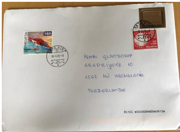
Afbeelding 4 Brief uit Zwitserland

een Corona postzegel van 1 Frank met een toeslag van 5 Frank, als men een velletje kocht van 10 zegels, kostte dit alleen 50 Frank en kreeg men de frankeerwaarde gratis. De post moedigde zo het schrijven van brieven aan, en ook moedigde men zo aan om te doneren tegen het Corona-virus.