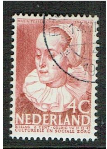
3 Maria Tesselschade

Roemersdochter Visscher, 1594-1649; Rembrandt Harmenszoon van Rijn 1606-1669 schilder; Herman Boerhaave 1668-1738 genees- en scheikundige.