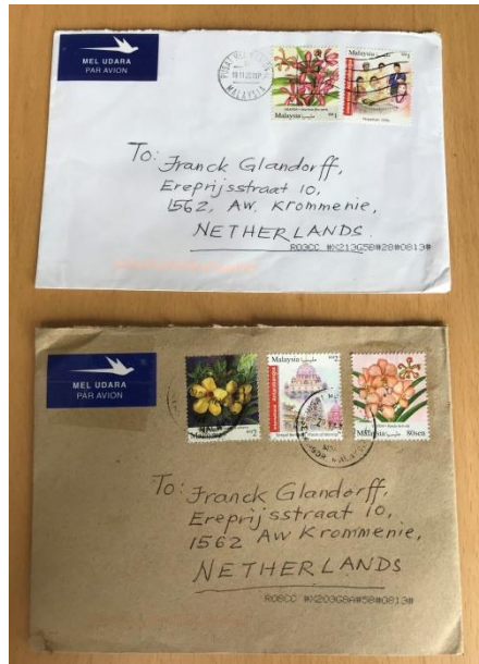
Afbeelding 5 Brieven uit Malaysië oud en nieuw porto tarief

nu was het opeens 4,80 Ringgit. Wat nog steeds slechts 96 Eurocent is, maar als je 2 ringgit ( 40 Eurocent) gewend bent, is het wel een tegenvaller.