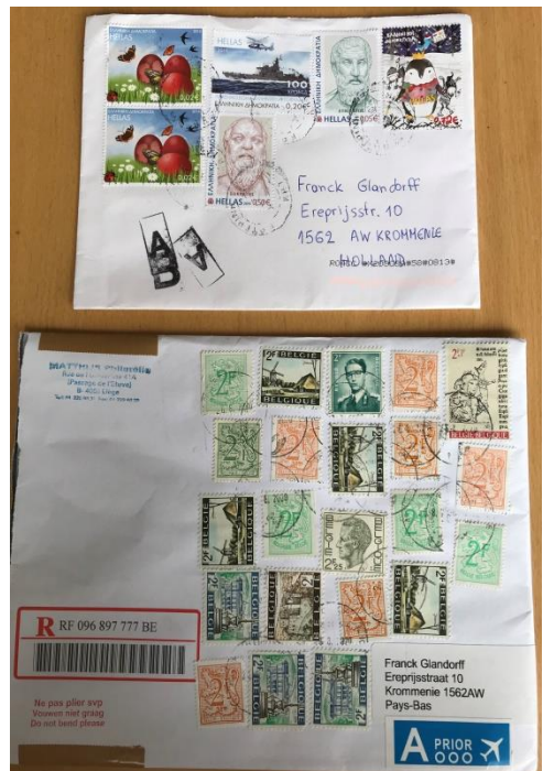
Afbeelding 7 Brief uit Griekenland

Het was en is een hele nare tijd, ook ik heb al mijn plannen om moeten gooien. 7 weken niet kunnen werken, in de plaats daarvan onze oudste zoon, die daar niet altijd zin in had, thuis onderwijs gegeven, geen enkel leuk beursbezoek of tentoonstelling, maar er zijn altijd lichtpuntjes. Op Internet vele leuke zegels en series gevonden van mijn verzamelgebieden, per telefoon en brief contact onderhouden, en er waren echt wel dingen die we nog konden doen. Het was prachtig weer, dus bos, strand en speeltuinen konden bezocht worden, op rustige momenten. Dus ook al is dit absoluut geen leuke tijd, kijkt u vooral naar wat wel mogelijk is in uw situatie. Dat is nog best aardig wat.